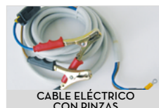
CABLE ELÉCTRICO CON PINZAS