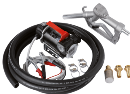
BATTERY KIT 3000 INLINE