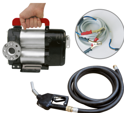
BATTERY KIT BIPUMP