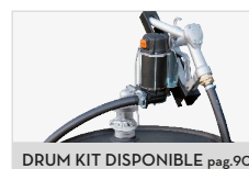
DRUM KIT DISPONIBLE pag.90