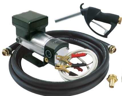
BATTERY KIT OIL