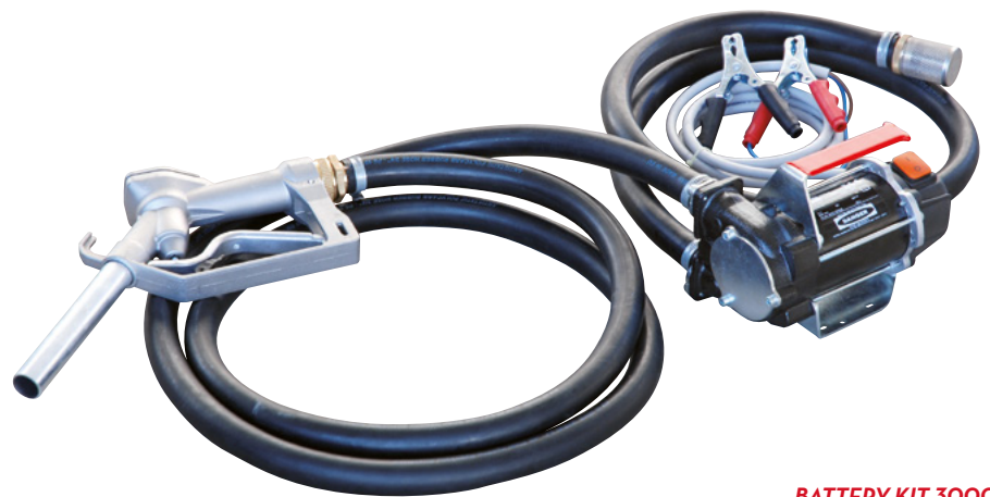
BATTERY KIT 3000