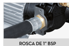
ROSCA DE 1" BSP