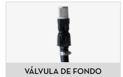
VÁLVULA DE FONDO