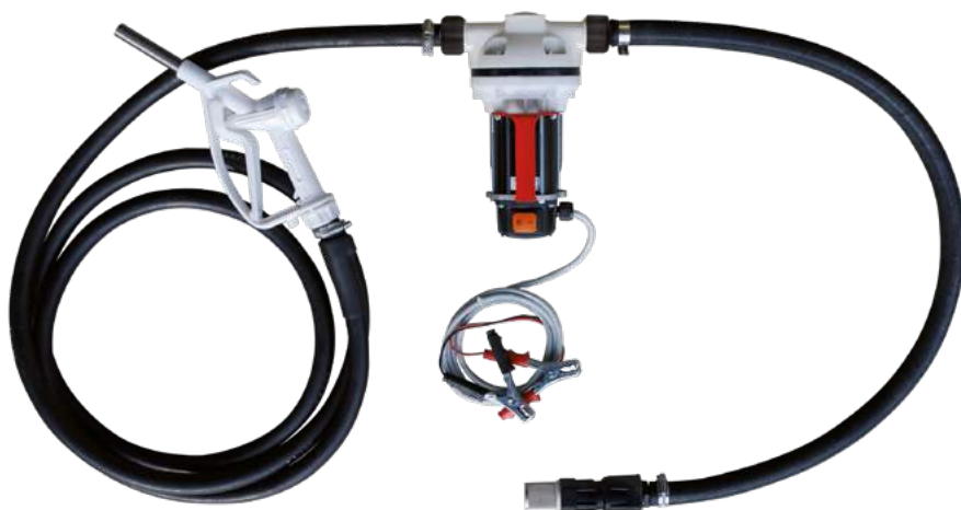
SUZZARABLUE PORTABLE KIT