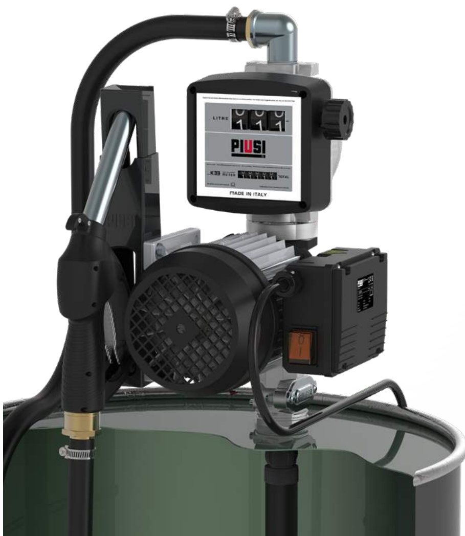
DRUM VISCOMAT VANE