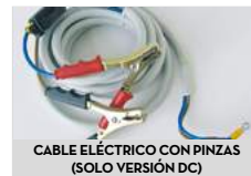
CABLE ELÉCTRICO CON PINZAS (SOLO VERSIÓN DC)