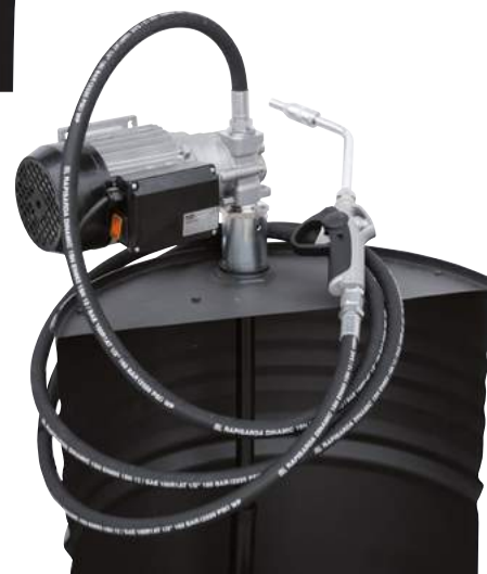
VISCOMAT GEAR DRUM AC