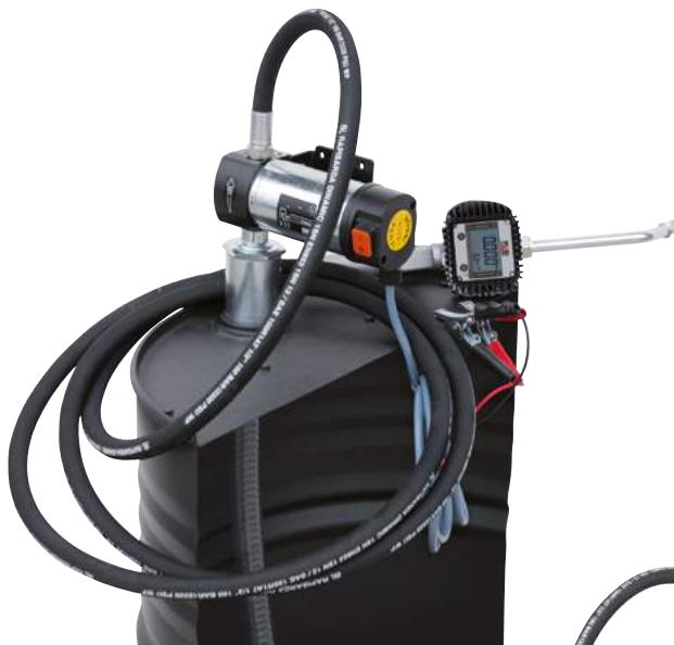
VISCOMAT GEAR DRUM DC